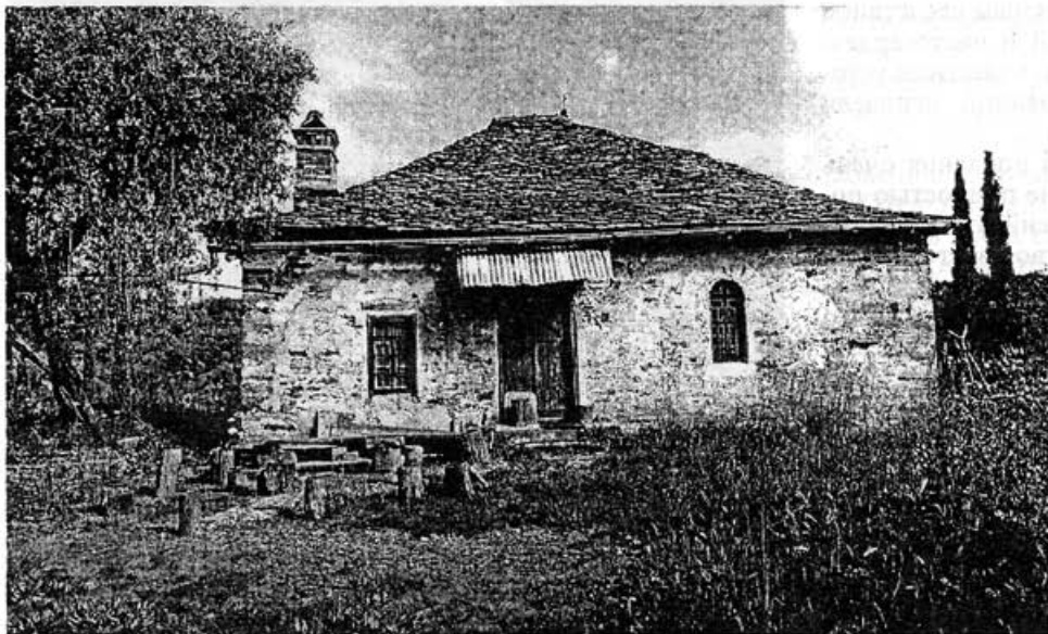
“Панагуда” — последняя афонская келия старца Паисия, лежащая в сотне метров от монастыря Кутлумусиу

Когда ты познаешь себя самого, восчувствуешь свою великую греховность и великие к тебе Божие благода-