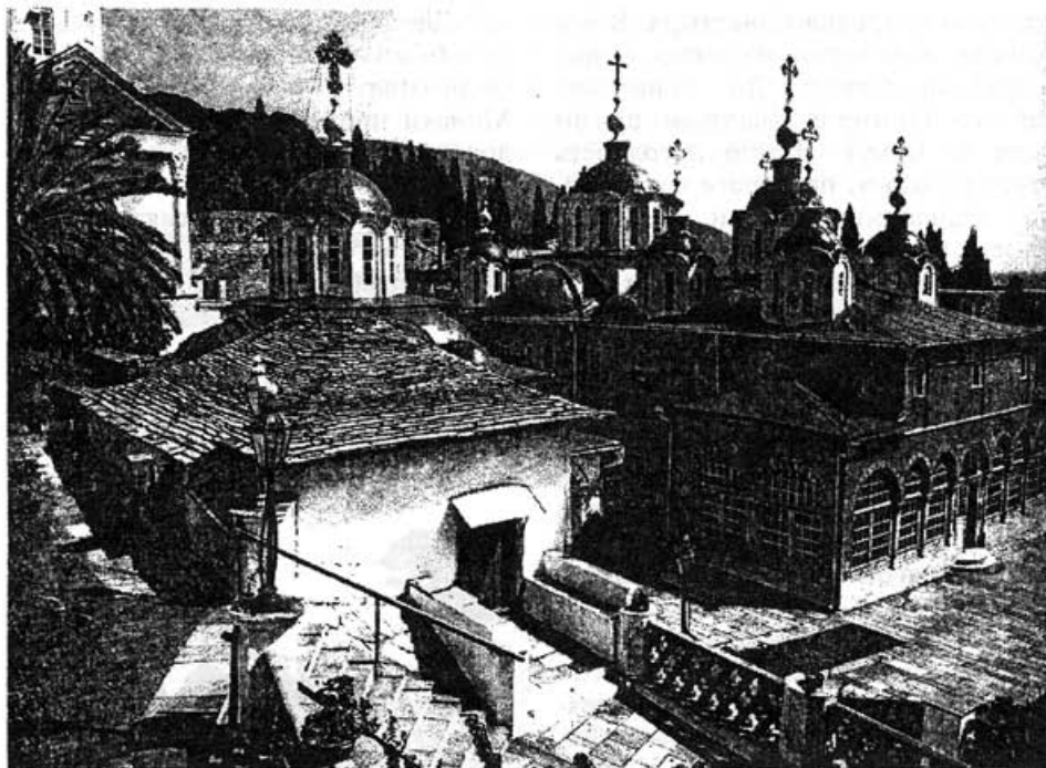
Русский Пантелеимонов монастырь