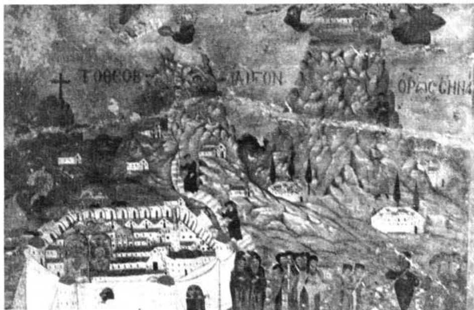
Гора Синай. Икона XVII в.