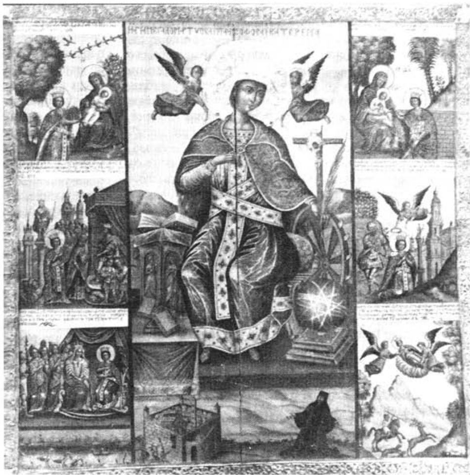
Икона великомученицы Екатерины