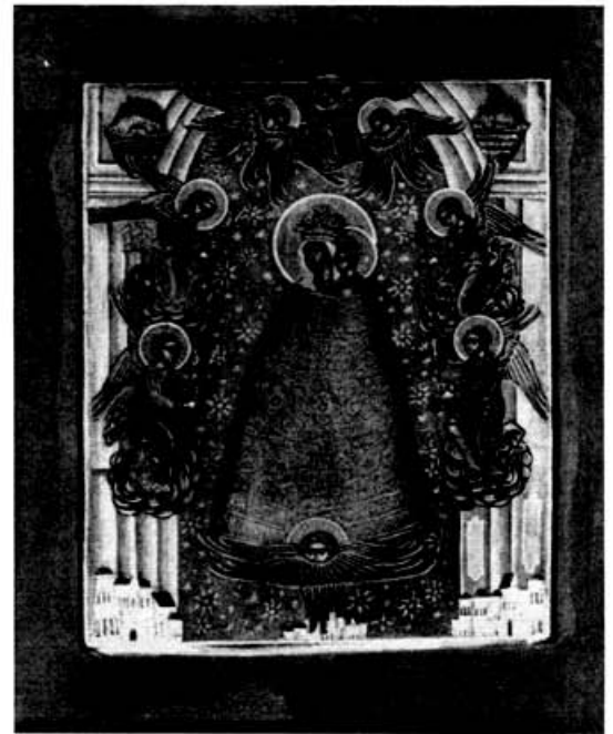
Икона “Прибавление ума”, XIX в., собрание ЦАК МДА

Подобная иконография не имеет аналогов среди традиционных иконописных подлинников и, следовательно, не может быть списком с какой-либо древней русской или греческой иконы. Что же касается ее прославления, то здесь мы тоже, к