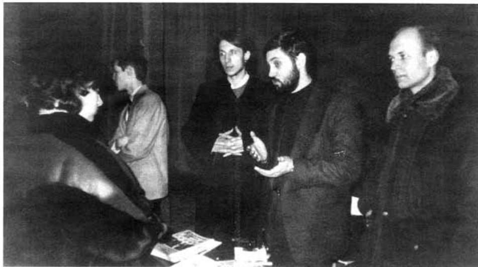
На одной из миссионерских встреч в Липецке

В начале беседы нам был задан вопрос о том, реально ли возрождение духовности в нашем Отечестве в тяжелых условиях давления западной псевдокультуры и поддерживающих ее средств массовой информации. Впро-