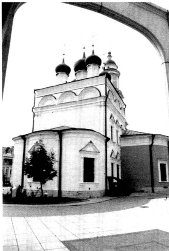
Храма Святителя Николая в Толмачах

— То есть музейный работник, занимающийся иконами, предметами культа, должен быть верующим?