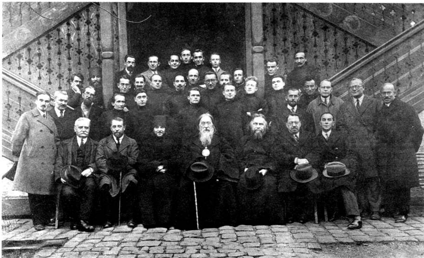
Митрополит Евлогий с преподавателями и студентами института. 1931 г.

стоящая на купленной территории, была отремонтирована и приняла вид, более напоминающий православный храм. Освящение престола, посвященного преподобному Сергию, было совершено 1 марта 1925 года.