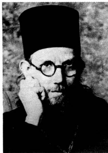
Профессор протоиерей Георгий Флоровский

Ярким примером некоторого противостояния обеих тенденций являются книги «Пути русского Богословия» Флоровского и «История русской философии» Зеньковского. Флоровский доказывал, что трагедия русской богословской школы в том, что волей исторических событий она удалась от наследия византийских Отцов. По мнению же Зеньковского, русская религиозная