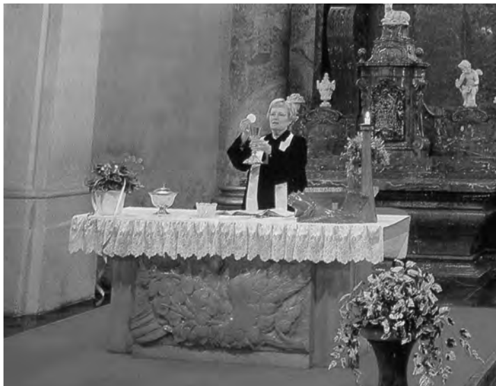
Женщина-священник Чехословацкой Гуситской Церкви совершает богослужение в Праге

Запада, становится вполне понятным. Константинополь в своей политике опирается на многочисленную, достаточно богатую и влиятельную греческую диаспору, рассеянную в странах Западной Европы и США.