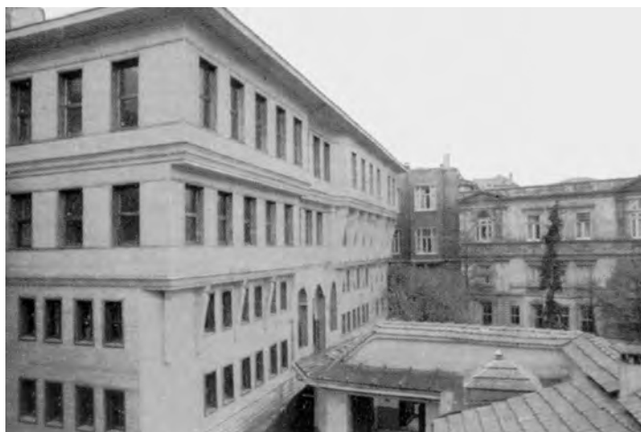
Здание Вселенской Патриархии в Стамбуле

В XX веке была сформулирована теория юрисдикционного примата Константинопольского Патриархата над всей православной диаспорой, то есть над приходами и монастырями, находящимися за пределами традиционно православных стран. Если учесть, что непосредственная паства Константинопольского Патриарха составляет всего несколько десятков тысяч человек — греков, проживающих в Турции, то особый интерес и внимание Константинополя к православной диаспоре, живущей в странах