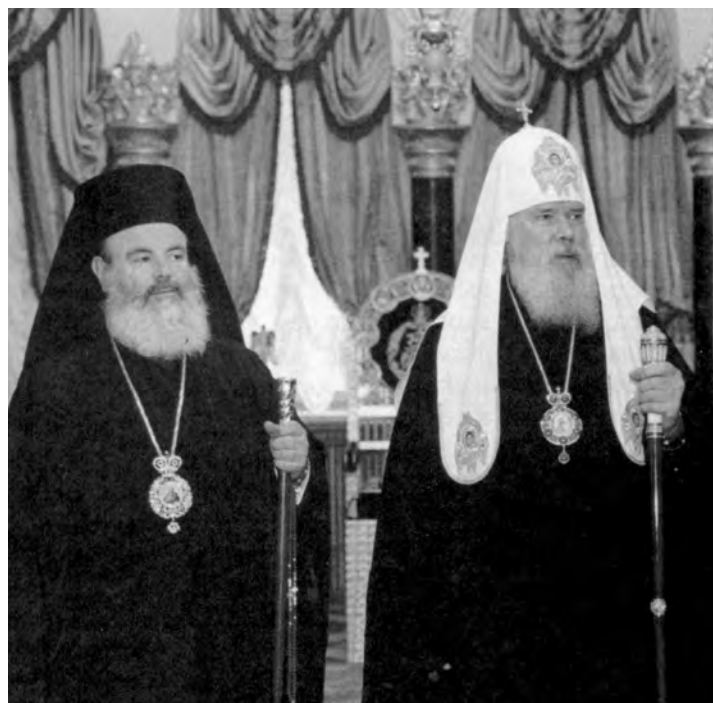
Святейший Патриарх Московский и всея Руси Алексий II и Блаженнейший Архиепископ Афинский и всея Эллады Христодул

Таким образом, в начале XXI века перед духовным образованием стоит важная задача — определить свое место в системе богословского образования, как российского, так и международного, не утрачивая своей самобытности и не впадая в крайности изоляционизма. Эту задачу выполнить нелегко, особенно учитывая характер Духовной школы как закрытого учебного заведения и требования известной открытости, которое предъявляется на любом рынке к его участнику. Думается, что суть решения данной проблемы заключается в переносе акцента с закрытости внешней, понимаемой как изолированность учащихся от воздействий греховного мира, на закрытость внутреннюю как на неприятие всех тех греховных явлений, которые окружают человека в миру, и выработку навыка твердого сопротивления им.