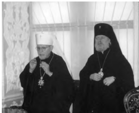
Блаженнейший Митрополит Феодосий в Московской Духовной Академии

5 декабря 2001 года Троице-Сергиеву Лавру и Московскую Духовную Академию посетил Предстоятель Православной Церкви в Америке Блаженнейший Архиепископ