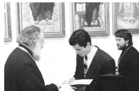
Юбилей журнала «Церковь и время»

10 октября 2001 года в Отделе внешних церковных связей состоялся торжественный акт, посвященный десятилетию журнала «Церковь и время». Первый номер этого журнала увидел свет в октябре 1991 года. В 1992 году сложная общественно-политическая и экономическая ситуация, сложившаяся в России, привела к вынужденной приостановке издания «Церковь и время» на долгие шесть лет. В 1998 году журнал вновь стал выходить в свет в новом формате. В настоящее время готовится к публикации уже семнадцатый его номер. За последние три года журнал зарекомендовал себя как научное издание высокого уровня. В нем наряду с исследованиями из области богословия и церковной истории публикуются важнейшие документы новейшего периода истории РПЦ.