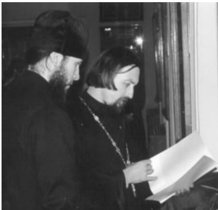
За обсуждением докладов

нарии, то высказываются такие предложения: первые четыре года обучения будут посвящены преимущественно изучению тех дисциплин, которые и составляют государственный теологический стандарт. Надо при этом помнить, что не обязательно это будут литургика, догматика и прочие богословские дисциплины. Естественно, этим предметам будет уделяться определенное внимание, но все же углубленному их изучению, по замыслу авторов реформы, будет посвящен пятый год обучения. Как сказал об этом митрополит Кирилл, пятый курс «...должен быть исключительно пастырским. Если, допустим, в семинарии учится человек, который не хочет стать священником или, может быть, учится девушка (это вполне возможно), то достаточно закончить четыре года и получить диплом бакалавра. Если же студент хочет быть священником, нужно закончить пятый год — пастырский. Там будет изучаться: практическое руководство для пастырей, церковный устав, пение, основы канонического права, практические занятия, то есть все те дисциплины, которые готовят священника. Так вот, по окончании пятого года можно будет получать диплом специалиста, что соответствует нашему государственному диплому об окончании вуза».