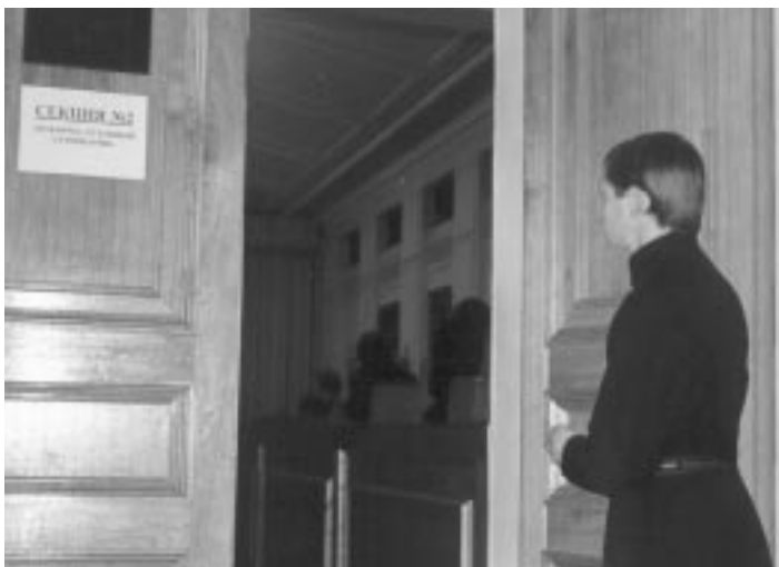
Духовное образование: начало пути

По окончании заседания была организована пресс-конференция, на которой выступавшие ответили на вопросы аудитории. Более подробную информацию (доклады участников) можно найти на портале Учебного комитета ( http://www.bogoslov.ru ).