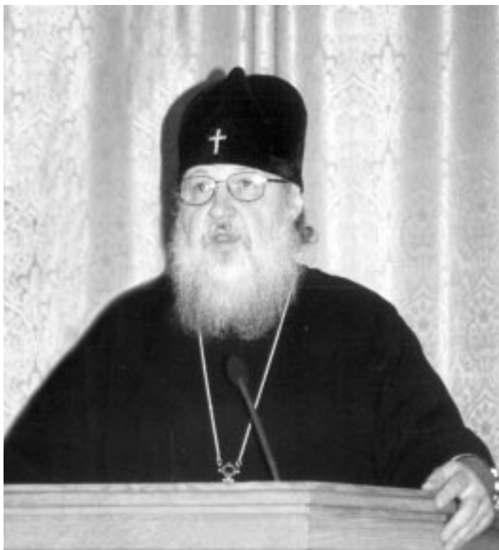
Митрополит Смоленский и Калининградский Кирилл

преобразований, имевшая своей главной целью, во-первых, дальнейшее развитие и упрочение традиций Духовных школ как центров подготовки прежде всего будущих пастырей Церкви, а, во-вторых, создание предпосылок для повышения уровня преподавания богословской науки. Это мнение разделяли и другие докладчики.