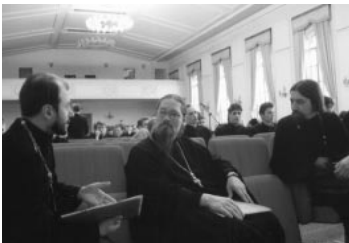
Преподаватели Духовных школ обсуждают доклады