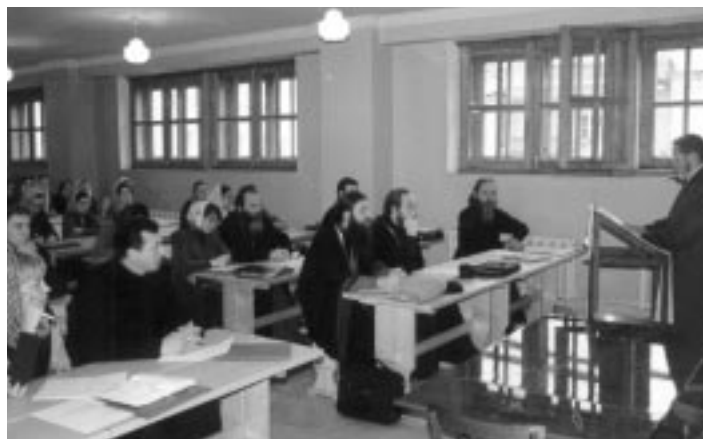
Работа в секциях

Другая подобная ситуация, возникшая в процессе разрешения проблемы, — непонимание многими государственными мужами разницы между терминами «светский» и «атеистический». Светский характер образования, прописанный в наших законах, воспринимается ими только в контексте отсутствия или даже неприятия в учебных курсах любых религиозных идей. Хотя нет ни одного документа и тем более закона, в которых бы говорилось о государственной системе атеистического образования. В результате многолетних обсуждений и споров руководство Министерства образования, наконец, согласилось, что «светское» и «атеистическое» — это вещи совершенно разные. Характерно в этом смысле высказывание С.В.Кириенко: «Да, в школах и в институтах исчез курс научного атеизма. Но если разобраться с мировоззренческими установками, заложенными в основу школьных программ, мы вынуждены будем признать, что онтологически и с точки зрения ценностного ряда, школьное образование построено на философии атеизма (даже если преподаватели не отдадут себе в этом отчета). И государство, поддерживая такое положение вещей, не создает сегодня равных условий для различных мировоззрений, а значит, нарушает заявленный