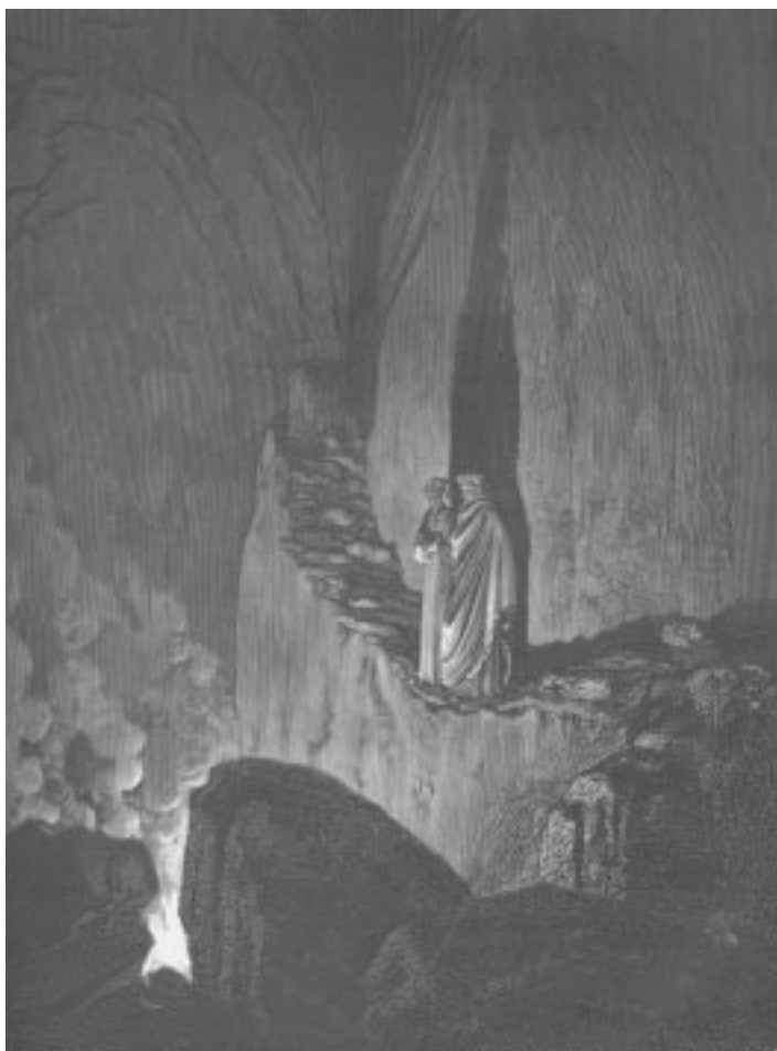
Гравюры Гюстава Доре

«Подноготную, вырытую в земле» Достоевским, можно условно разделить на три круга. Первый круг — это самая наша, как писал Достоевский, «адская жизнь», те тяжелые условия и страдания, которыми она наполнена, в широком христианском смысле — это мир, лежащий во зле. «Мне кажется, — пишет 27-летний Федор Михайлович брату, — мир принял значение отрицательное». 3 Развернутой метафорой первого круга стал Петербург Достоевского, скученная и беспробудная жизнь которого напоминает дантовскую картину из четырнадцатой песни «Ада»: