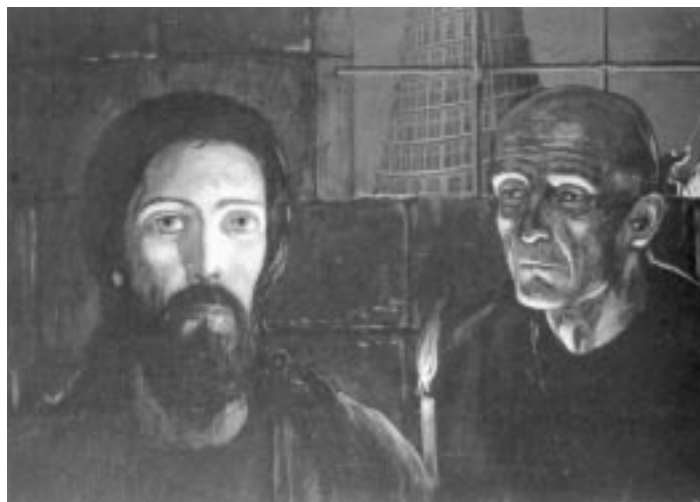
Христос и Инквизитор. Иллюстрация Ильи Глазунова

Второй круг ада у Достоевского располагается в плоти и сердце человеческом, где бурлят страсти. Если в первом круге — скученность, нищета, уродство, нестерпимая жара и вонь, то во втором — все в движении, кипит и клокочет. Здесь вовсе «не скучно гулять», наоборот, часто бывает весело, но веселье, в которое погружаются, к примеру, Митя Карамазов или Рогожин, замешено на отчаянии. Во втором круге царит хаос и буря. «Насекомым — сладострастье!» — в исповеди-вызове кричит Митя, — «это насекомое живет и в крови твоей бури родит. Это — бури, потому что сладострастье буря, больше бури!» 3 Символом «второго круга» Митя называет ядовитую фалангу. Сладострастье — это хищное и ядовитое существо, которое «жалит» и тем самым оскверняет невинность. Галерея сладострастников у Достоевского выразительно отвратительна, образ искусителя вырастает в губителя чистой девы: барин и девочка на бульваре, Свидригайлов и Дуняша, Свидригайлов и его юная невеста, Федор Павлович Карамазов и целый ряд жертв, Ставрогин и Матреша... Список можно продолжать и продолжать... Второй круг — это царство эроса и отчаяния, грозящего смертью. Алеша, после исповеди Мити, которая и провела их по второму кругу ада, кричит брату: «Митя, ты несчастен, да! Но все же не