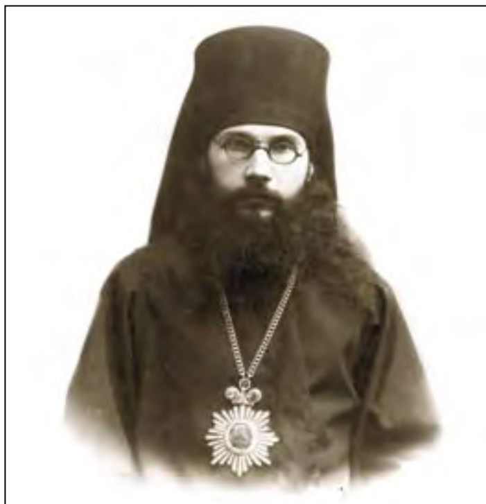
Архиепископ Феодор (Поздеевский)

их было только 191 русских и 24 иностранца. Во всех четырех Академиях на 1898 год училось 900 человек на всю Россию». С таким отрядом молодых ученых Церковь готовилась встретить наступающий XX век.