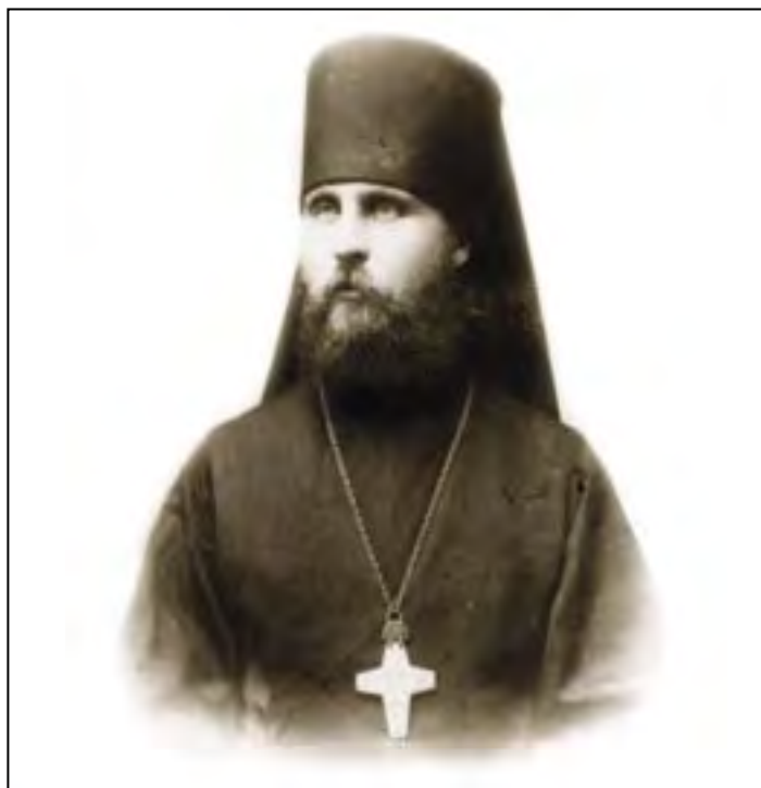
Священномученик Иларион (Троицкий)