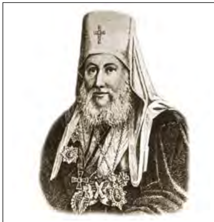
Митрополит Евгений (Болховитинов)

К 1880 году относится возникновение «Братства Преподобного Сергия для вспомоществования нуждающимся студентам и воспитанникам Московской духовной