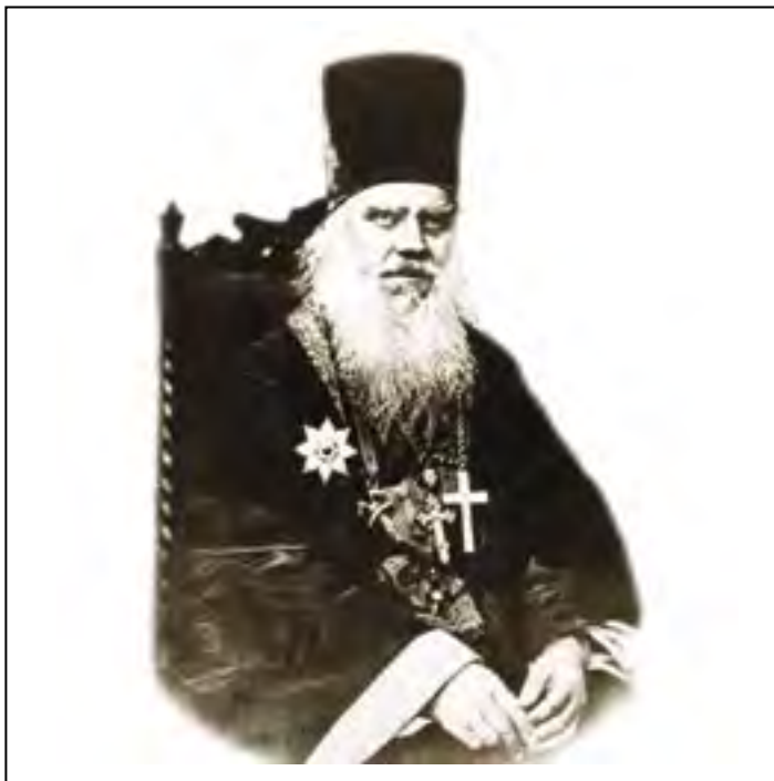
Протоиерей Александр Горский

Уже в январе 1842 года редакционный комитет представил митрополиту Филарету первые переводы слов святителя Григория Богослова. Одновременно был создан и печатный орган Академии — журнал «Прибавления к творениям святых отцов», где публиковались статьи церковно-исторического и богословского содержания.