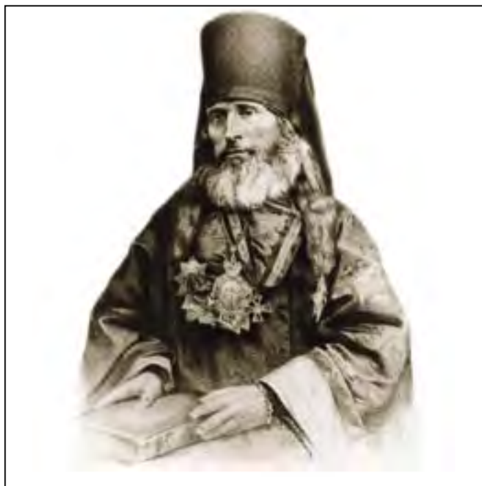
Архиепископ Филарет (Гумилевский)

Святитель Московский Филарет (Дроздов) является крупнейшей личностью всей истории МДА. Он много сделал и для Санкт-Петербургской, и даже для Киевской академии. Но Московская духовная академия стала в полном смысле слова детищем митрополита Филарета — он придал ей дух и направление, бдительно следил за чистотой богословской науки. Митрополит руководствовался мыслью о создании устойчивой богословской преемственности, не нарушаемой посторонними веяниями. В 1847 году обер-прокурору Н.А. Протасову он писал: «...кандидатов в ректора МДА и профессора богословских наук не должно искать далее здешней Академии и здешних семинарий... В сих местах удобнее довершается акаде-