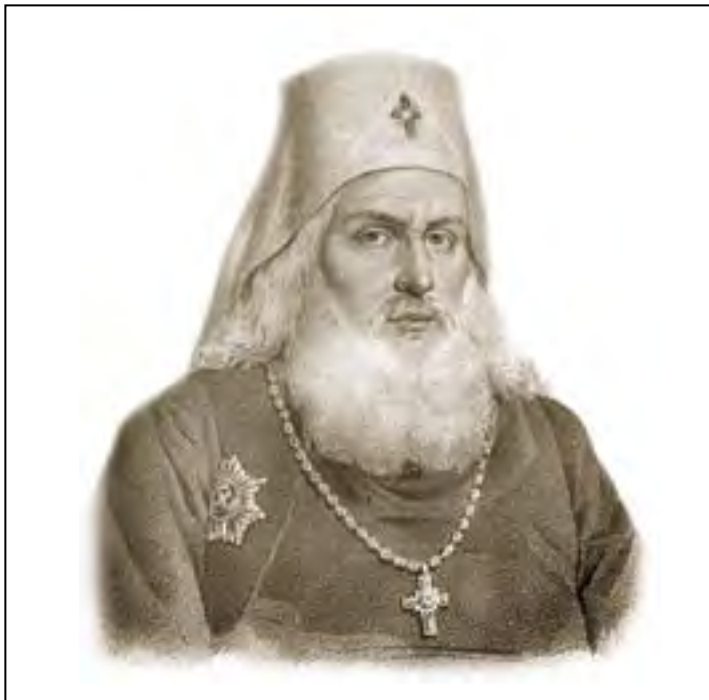
Митрополит Платон (Левшин)

родного языка: преподавание древних и новых языков ведется на родном языке, самим владыкой на русском языке написан труд «Христианское богословие», начинается преподавание истории Русской Церкви, которой митрополит сам серьезно занимался.