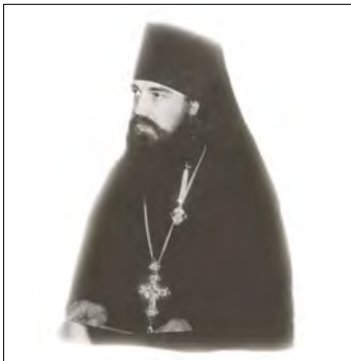
Архимандрит Филарет (Вахромеев), ныне митрополит Минский и Слуцкий