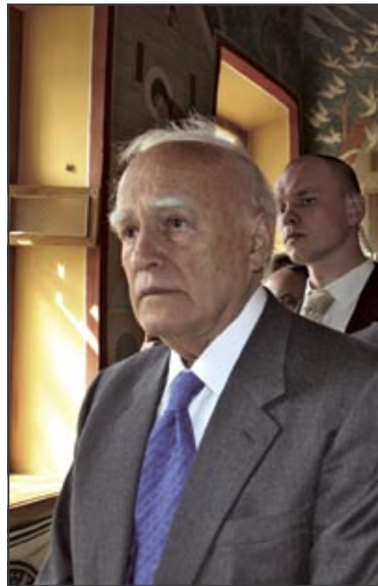
Президент Греции К.Папульяс

«Я очень рад, что нахожусь сегодня в сердце духовной жизни России, я заберу с собой свет этого места», — сказал президент на торжественном обеде, устроенном в его честь.