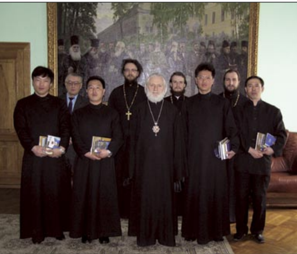
Северо-корейские выпускники Московской духовной семинарии с руководством МДАиС