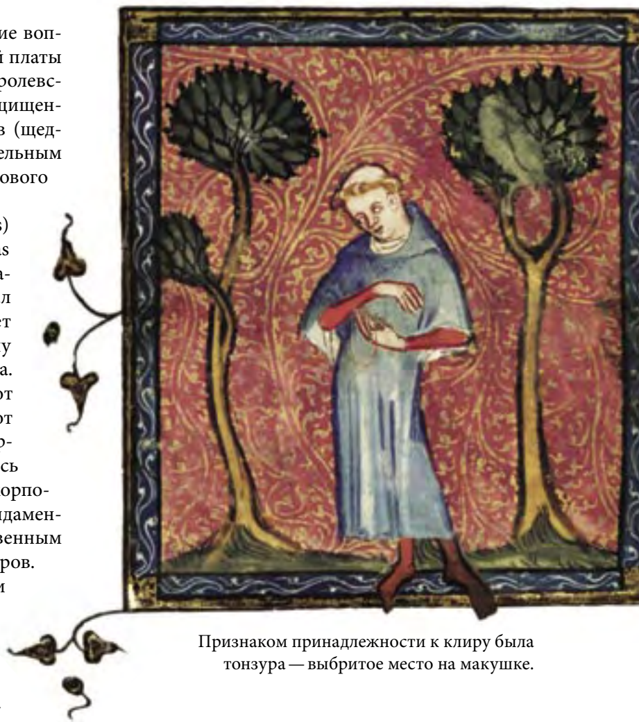
Признаком принадлежности к клиру была тонзура — выбритое место на макушке.

Насколько дорожили университетами и церковные, и светские власти, показывает следующая история, ознаменовавшая окончательную победу Оксфордского университета в борьбе с городом. 10 февраля 1355 года, в день святой Схоластики несколько студентов, найдя неудовлетворительным качество вина в местном погребе, начали швырять бутылками и стаканами в хозяина заведения. Друзья пострадавшего ударили в набатный колокол церкви святого Мартина. По всему городу начались беспорядки и стычки горожан со студентами, продолжавшиеся три дня. Многие здания колледжей и общежитий были разрушены. Большинство студентов покинуло город. В ответ на поданную жалобу король и духовные власти начали расследование. На Оксфорд был наложен годовой интердикт — на время работы следствия. В результате последовавших санкций большая часть экономики города попала под контроль университета, который получил также правовую автономию. Кроме единовременного штрафа город-