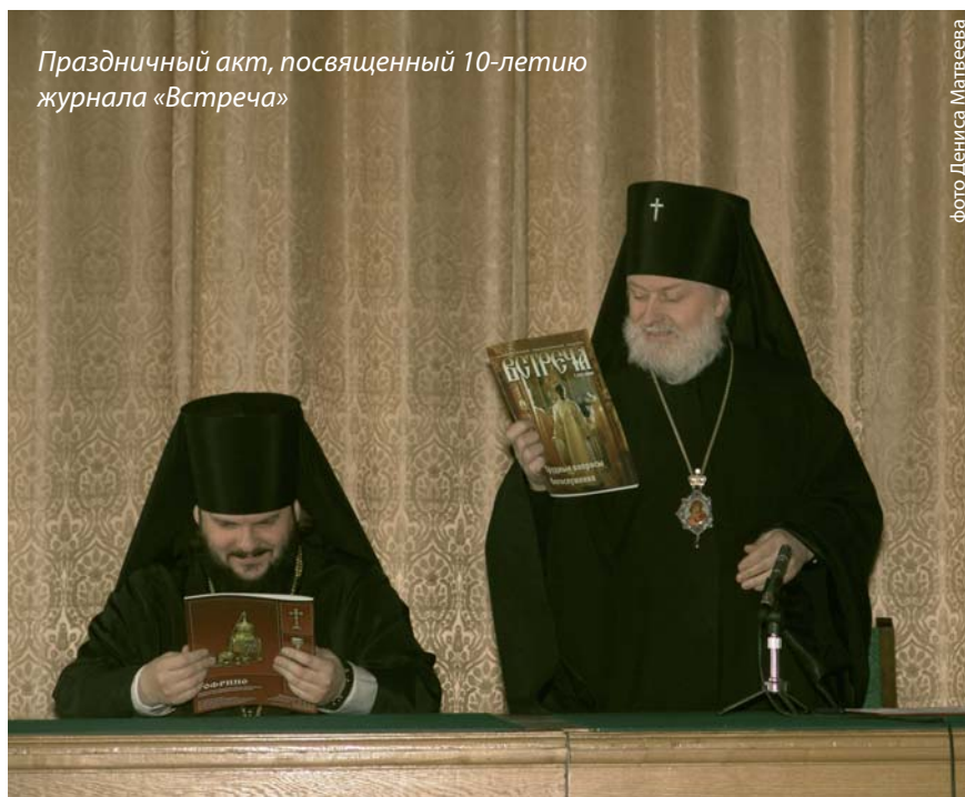
Праздничный акт, посвященный 10-летию журнала «Встреча»

За десять лет «Встреча» проделала путь от внутри-академического студенческого вестника до издания всероссийского масштаба. Специфика полностью студенческого проекта — все работы по подготовке номера от корректуры статей до фотосъемки и верстки выполняют студенты — предполагает частую смену состава редакции: одни сотрудники заканчивают учебу, на их место приходят новые. За десять лет существова-