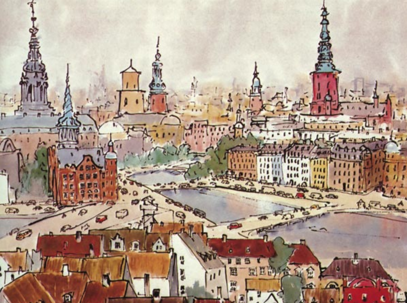
Копенгаген. Рисунок Павла Кокорина

новому осознать себя Телом Христовым» — мы были частью большого движения за традиционное христианство в западноевропейских странах. Как члены этого братства мы были убеждены в «праве и обязанности принесения Святых Даров — Тела и Крови Господних — для спасения живых и мертвых». Такое выражение было несомненно католическим, но вполне совместимым с вероучением лютеранской Церкви, которая сохраняла общение со Христом через Евхаристию.