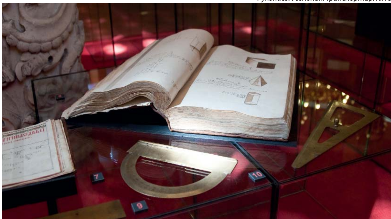
Л. Магницкий. Арифметика. VIII в. Рукопись. Угольник. Транспортир. XIX в.