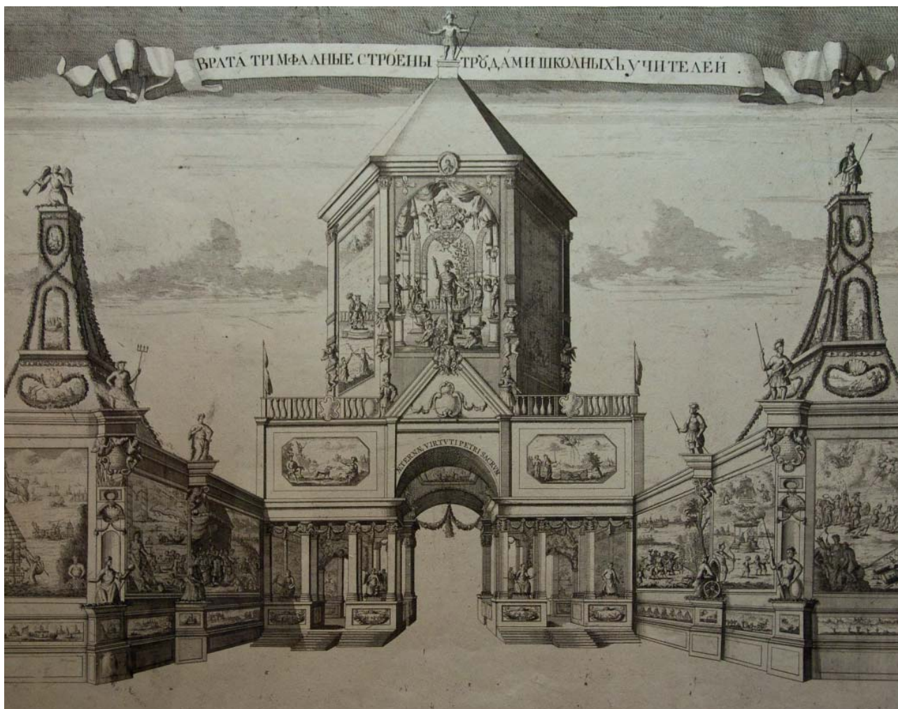
Триумфальные ворота, построенные трудами школьных учителей Славяно-греко-латинской академии. Гравюра. 1710 г.