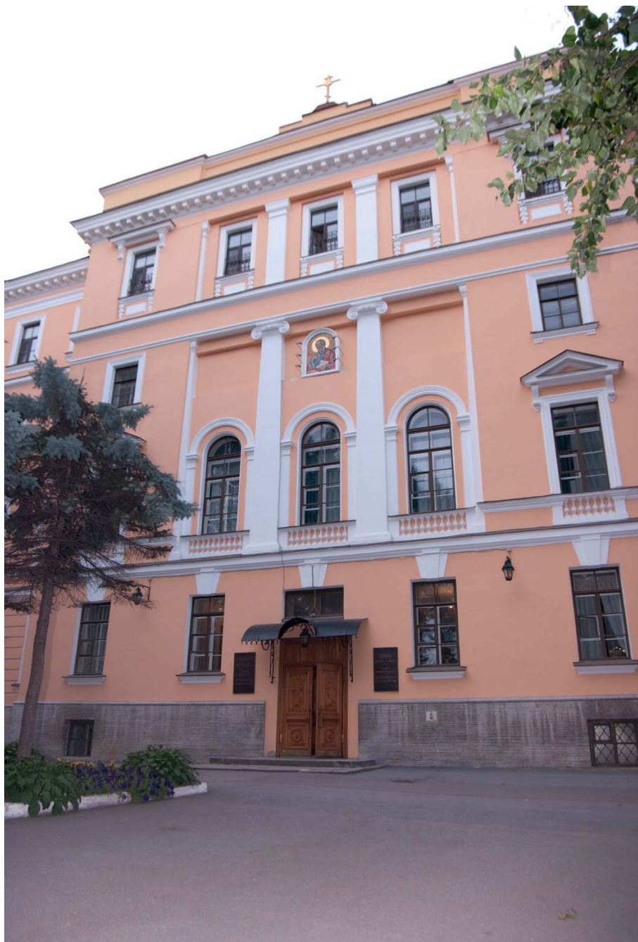
Здание Санкт-Петербургской духовной академии

В наш век глобальных процессов, всемирной стандартизации и унификации это кажется странным и даже в чём-то опасным. Один мой приятель, когда мы заговорили на схожую тему, с жаром объяснял: «Ну, посмотри, ведь так хорошо, когда высшие школы похожи друг на друга. Мы учимся по единой программе, получаем дипломы единого